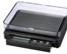
Cân bỏ túi DZ Xem chi tiết >>